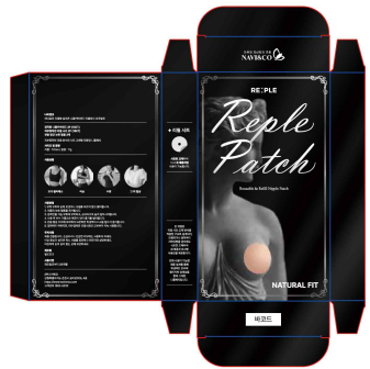
나비엔코 패키지 디자인 제작