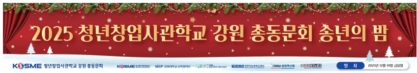
청년창업사관학교 송년의밤 키비주얼 제작